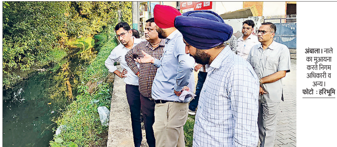
अंबाला। नालों का मुआयना करते निगम अधिकारी व अन्य।