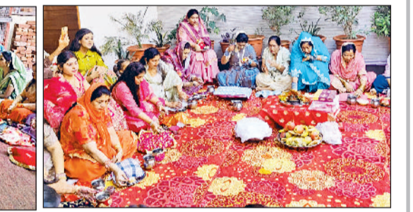
तरावड़ी। तरावड़ी में सुहागिनें मेहंदी लगावाते हुए।