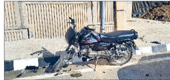
शहजादपुर। अस्पताल में उपचाराधीन जख्मी व क्षतिग्रस्त बाइक।