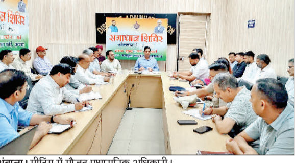
अंबाला। मीटिंग में मौजूद प्रशासनिक अधिकारी।