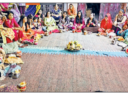
करनाल। करवाचौथ पूजन से पूर्व तैयारी करती सुहागिनें।

सुहागिनों ने सूर्योदय से पहले सरगी ग्रहण कर व्रत की शुरुआत की। दिनभर निर्जला उपवास रखकर उन्होंने भगवान शिव, माता पार्वती और गणेश जी की पूजा की। चांद छलनी से चांद का दर्शन कर, अपने पति का चेहरा देखा व्रत का समाप्त किया