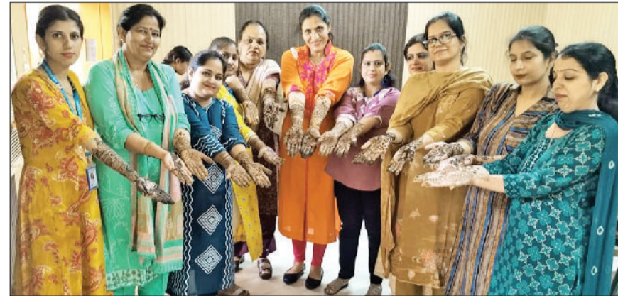
पानीपत। एसडी कॉलेज में करवाचौथ पर्व पर हाथों पर लगी मेहंदी का प्रदर्शन करते हुए अध्यापिकाएं व छात्राएं।

जागरूक करना ही इस प्रकार के आयोजनों को मनाने का ध्येय है। उन्होंने कहा कि कामयाबी के साथ जीवन में खुशियां और शान्ति मिले