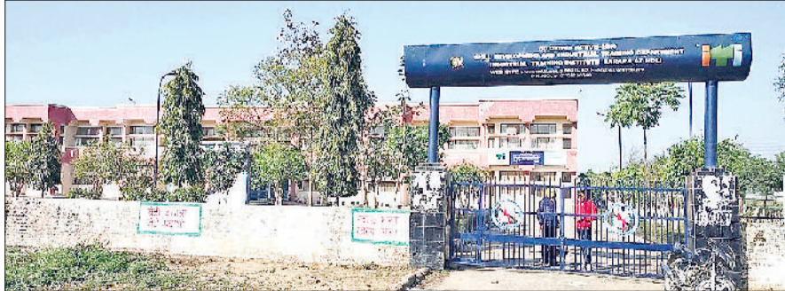
बराड़ा। आईटीआई का बाहरी दृश्य।

निदेशालय कौशल विकास एवं औद्योगिक प्रशिक्षण ने राज्य के सभी राजकीय औद्योगिक प्रशिक्षण संस्थानों एवं महिला आईटीआई में सत्र 2025-26 के लिए संस्थान स्तर पर ऑन द स्पॉट दाखिले की अंतिम तिथि को बढ़ा दिया है। अब